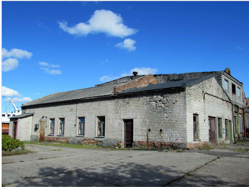
att. 29. XX gs. 2. puses ražošanas korpuss 002.