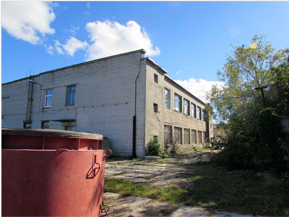
att. 28. XX gs. 2. puses ražošanas korpuss 010 skatā no krastmalas.