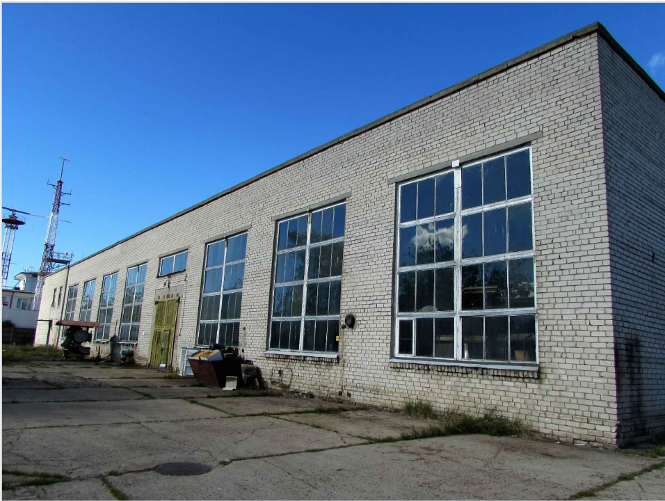
att. 27. XX gs. 2. puses ražošanas korpuss 010.