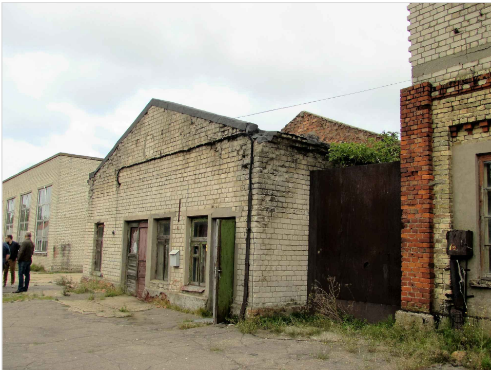
att. 31. XX gs. 2. puses ražošanas korpuss 002, tālumā 010.