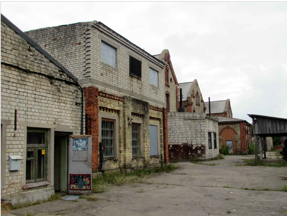
att. 30. XIX gs. sākuma korpuss 7 ar XX gs. otrajā pusē uzbūvēto otro stāvu. Priekšplānā ēka 002.